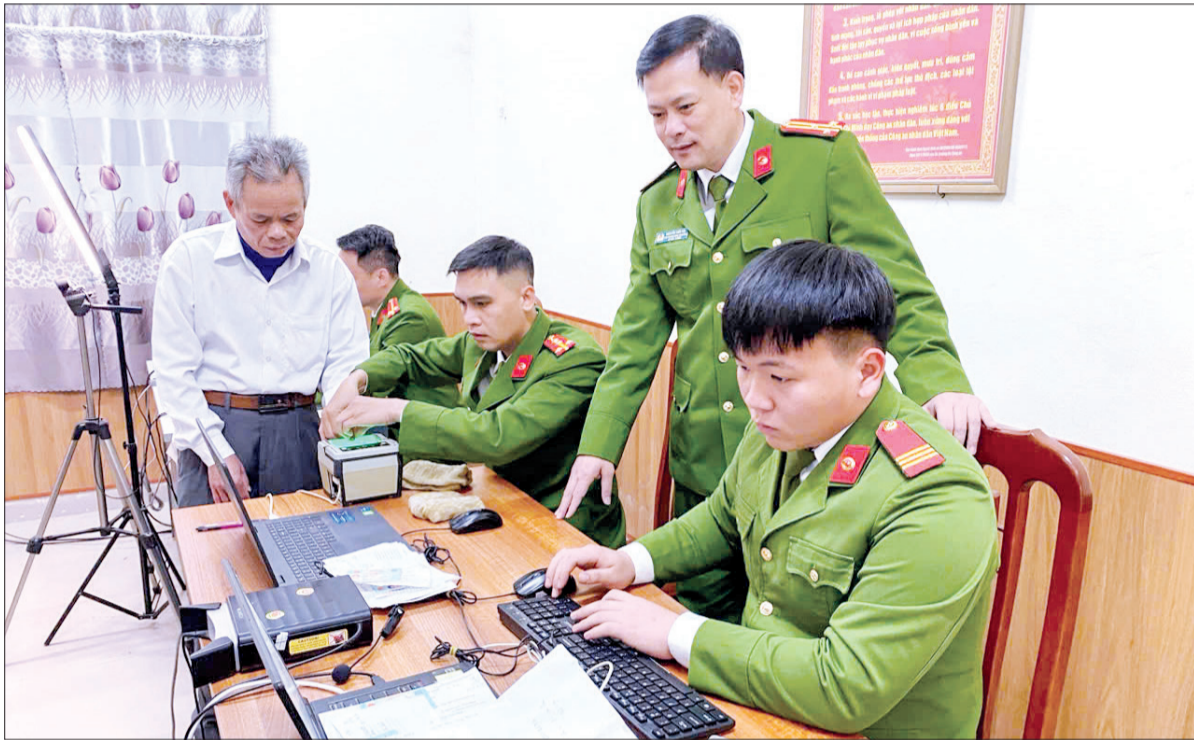
Vừa thực hiện sắp xếp tổ chức bộ máy, Công an huyện Tiên Hải vừa tập trung giải quyết các thủ tục hành chính cho người dân.

Việc triển khai mô hình tổ chức bộ máy mới khi không tổ chức công an cấp huyện và tiếp nhận nhiệm vụ quản lý nhà nước trên một số lĩnh vực là cuộc cách mạng về tổ chức bộ máy của lực lượng Công an nhân dân thật sự tinh gọn, hoạt động hiệu lực, hiệu quả. Công an tỉnh Thái Bình xác định đây là nhiệm vụ chính trị đặc biệt quan trọng, cần khẩn trương thực hiện với quyết tâm cao, nỗ lực lớn nên chủ động xây dựng kế hoạch, để án thực hiện từ sớm trình cấp có thẩm quyền phê duyệt. Đây là nhiệm vụ chính trị đặc biệt quan trọng, cần khẩn trương thực hiện với quyết tâm cao, nỗ lực lớn nên chủ động xây dựng kế hoạch, để án thực hiện từ sớm trình cấp có thẩm quyền phê duyệt. Đây là nhiệm vụ chính trị đặc biệt quan trọng, cần khẩn trương thực hiện với quyết tâm cao, nỗ lực lớn nên chủ động xây dựng kế hoạch, để án thực hiện từ sớm trình cấp có thẩm quyền phê duyệt.