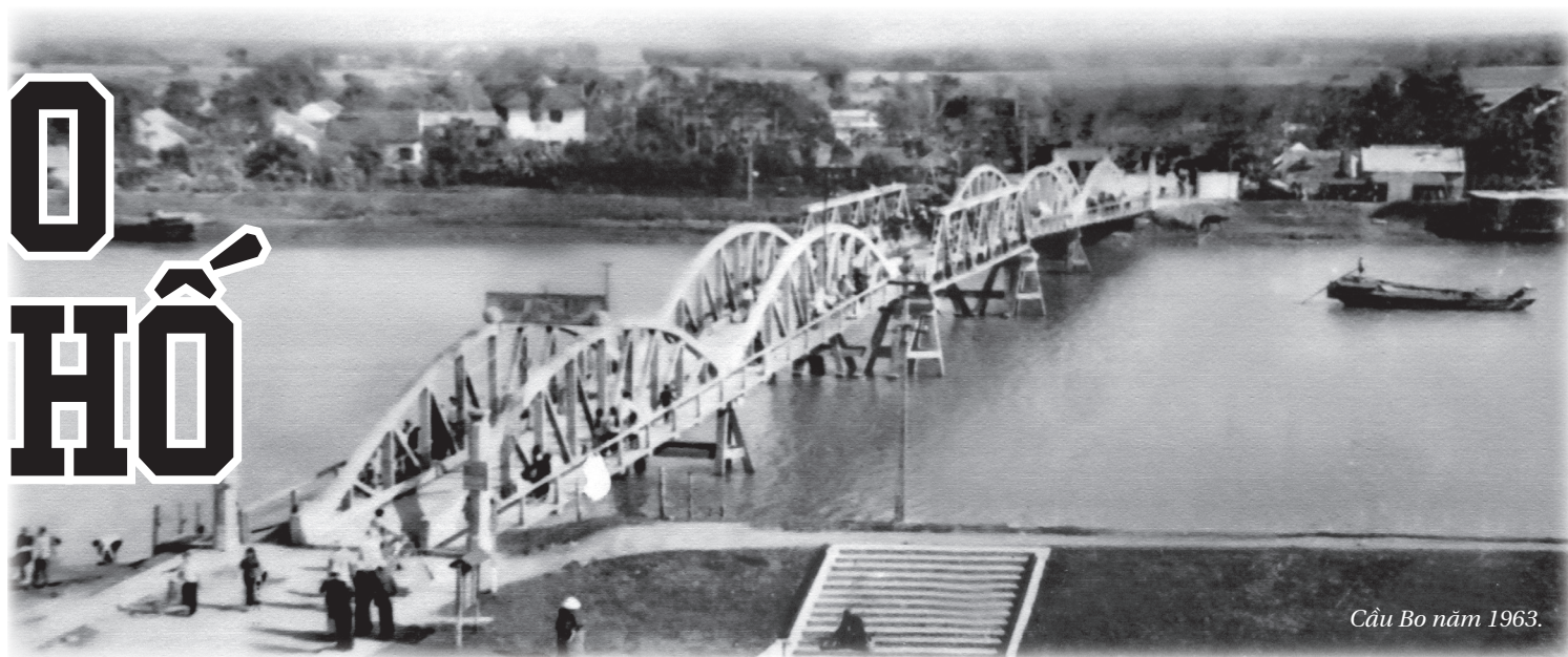
Cầu Bo năm 1963.