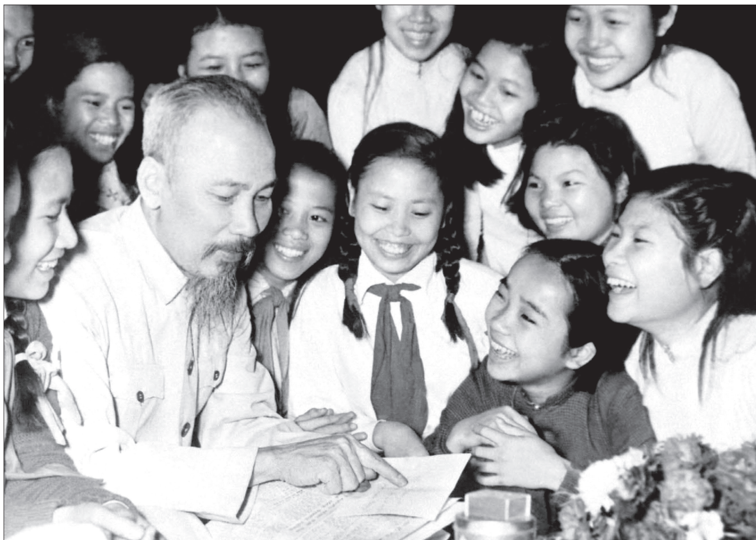
Ảnh tư liệu