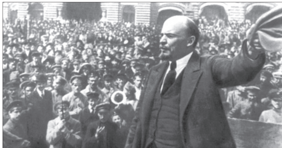
V.I. Lenin đọc diễn văn tại Quảng trường Đỏ ở Mát-xcơ-va trước các đơn vị tham gia khóa huấn luyện quân sự toàn dân, ngày 25/5/1919.

Thứ nhất, Đảng phải tiếp tục vận dụng nguyên tắc xây dựng đảng kiểu mới của chủ nghĩa Mác - Lênin, tư tưởng Hồ Chí