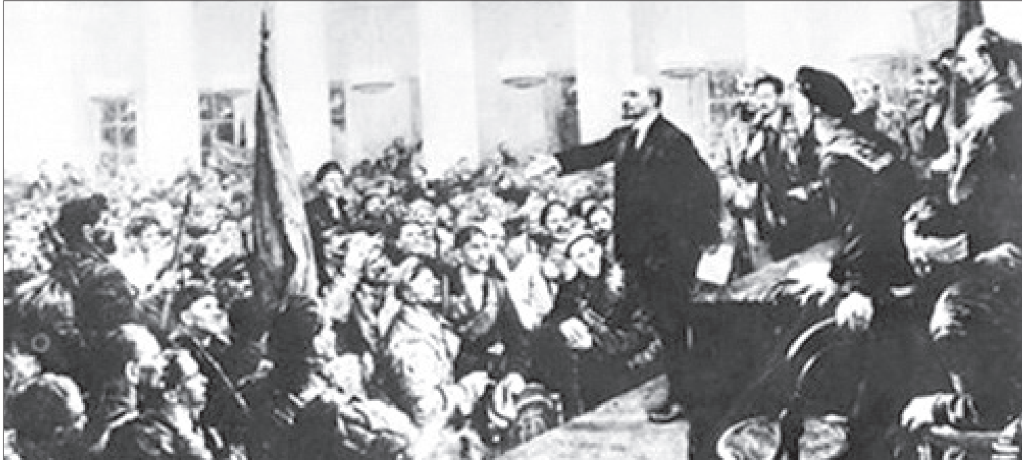
Lãnh tụ Đảng Bolshevik V.I. Lenin tuyên bố thành lập chính quyền Xô Viết tại Đại hội Xô Viết toàn Nga ngày 7/11/1917 tại điện Smolnya, ngay sau khi chiếm cung điện mùa đông. Ảnh tư liệu

Tiếp tục vận dụng chủ nghĩa Mác - Lênin vào xây dựng Đảng và đổi mới đất nước thì Đảng phải tự chỉnh đốn, làm trong sạch đội ngũ cán bộ, đảng viên.