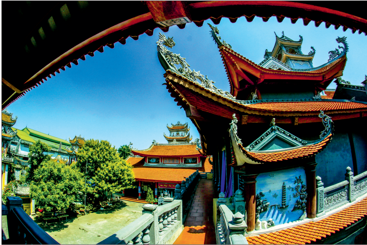
Chùa Lộng (Công đồng bản phủ) còn lưu giữ nhiều tư liệu văn bản Hán Nôm quý giá.