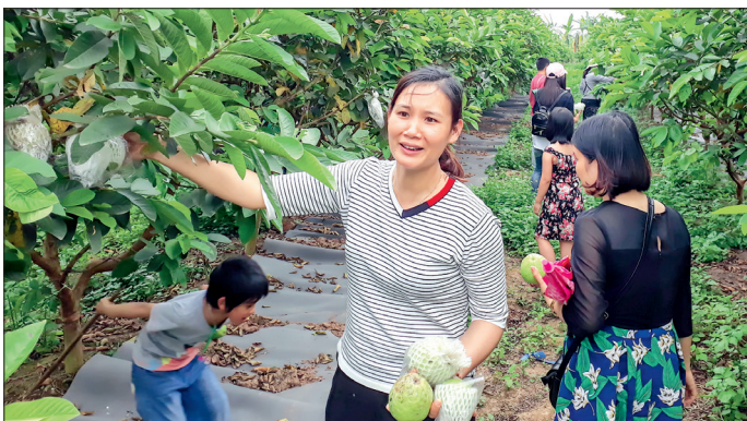
Du khách thích thú với sản phẩm nông nghiệp tại trang trại Surfam (xã Hồng An, huyện Hưng Hà).