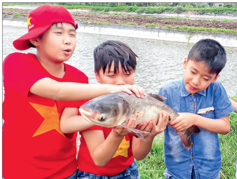
Du khách trải nghiệm tại trang trại của Hợp tác xã Ban Mai Bio (xã Thái Hồng, huyện Thái Thụy).

đường hơn 30km, xuống xe, các thành viên trong đoàn bắt đầu tham quan, trải nghiệm các công đoạn làm việc của trang trại. Có ông bố hướng dẫn con cách cho gà ăn, cách thu hoạch trứng gà; có bà mẹ lại hướng dẫn con cách chọn và cắt từng quả ổi lè... Tất cả giống như một buổi lao động chứ không còn là du lịch. Anh Bùi Đình Hiếu, chủ trang trại Surfam chia sẻ: Từ khi trang trại được mở đến nay, hàng năm đón rất nhiều đoàn khách du lịch ở các tỉnh về tham quan, trải nghiệm. Tại đây, những vị khách này sẽ trở thành những người nông dân thực sự khi không còn những bộ quần áo sang trọng hay những bộ váy đầm, thay vào đó là những bộ quần áo đơn giản, rộng rãi. Theo anh Hiếu, điều quan trọng nhất sau những buổi du lịch trải nghiệm này là các em nhỏ biết phân biệt các loại cây, con, các ông bố, bà mẹ chứng kiến được cách chăn nuôi gà sạch, trồng