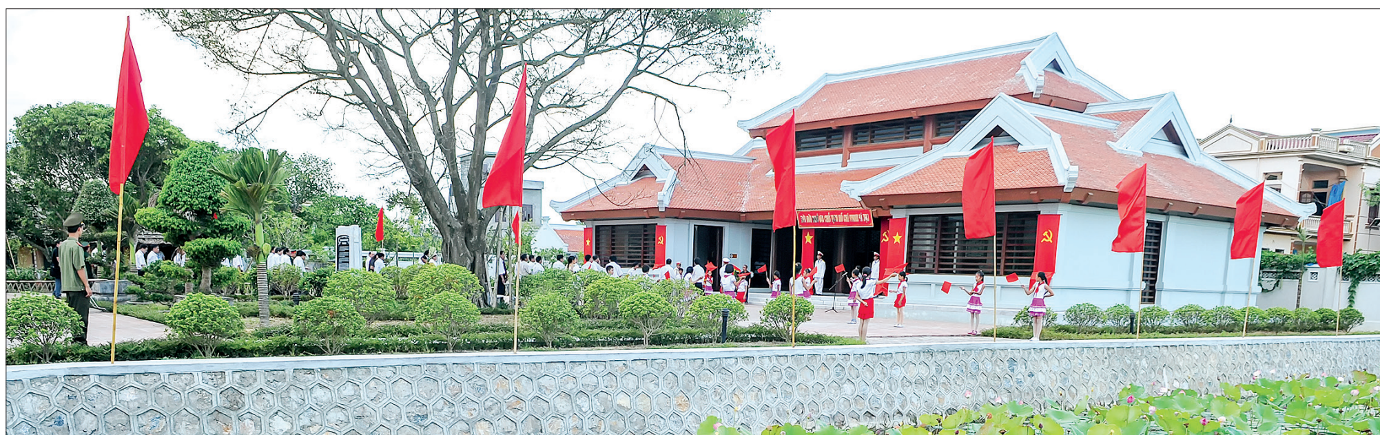
Khu lưu niệm Bác Hồ tại xã Tân Hòa (Vũ Thu).

Xin trân trọng giới thiệu cuốn sách cùng độc giả.